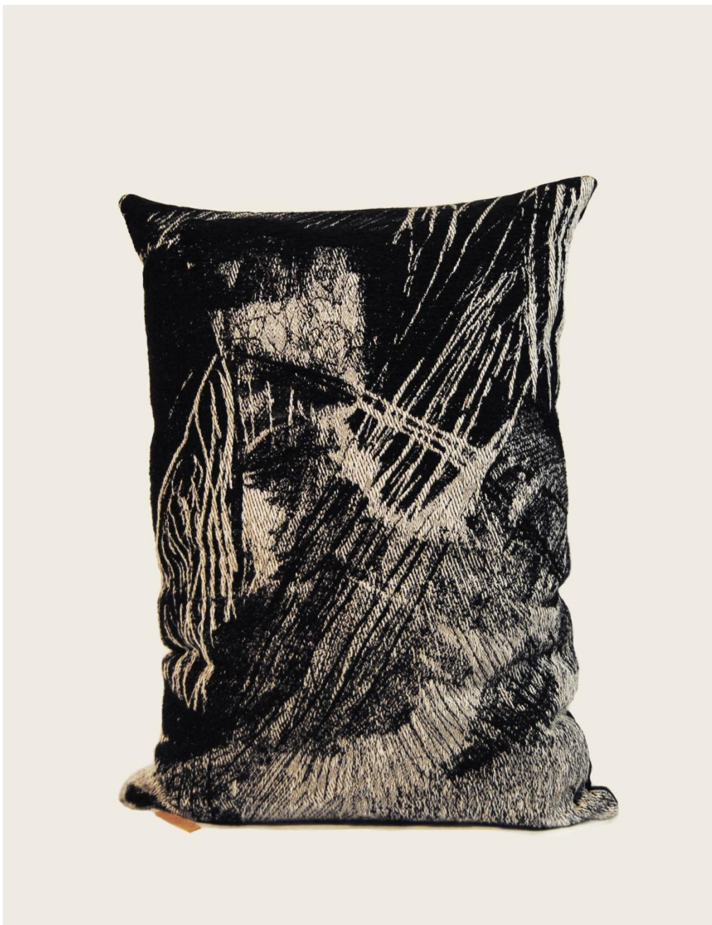
Pejzaż miejski, 65x90x30 cm. Materiały len, akryl, bawełna