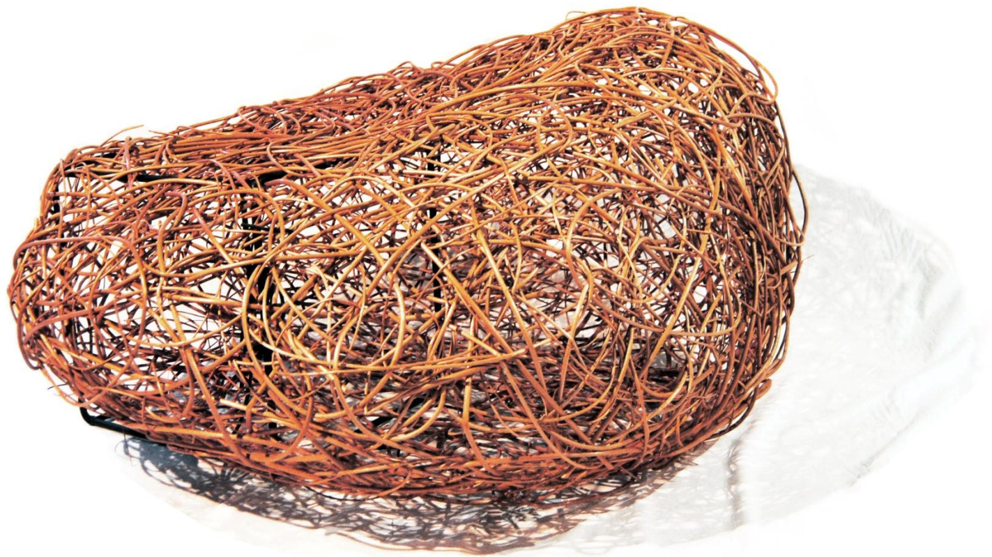
Remiz I rozmiar 110x120x57cm wiklina