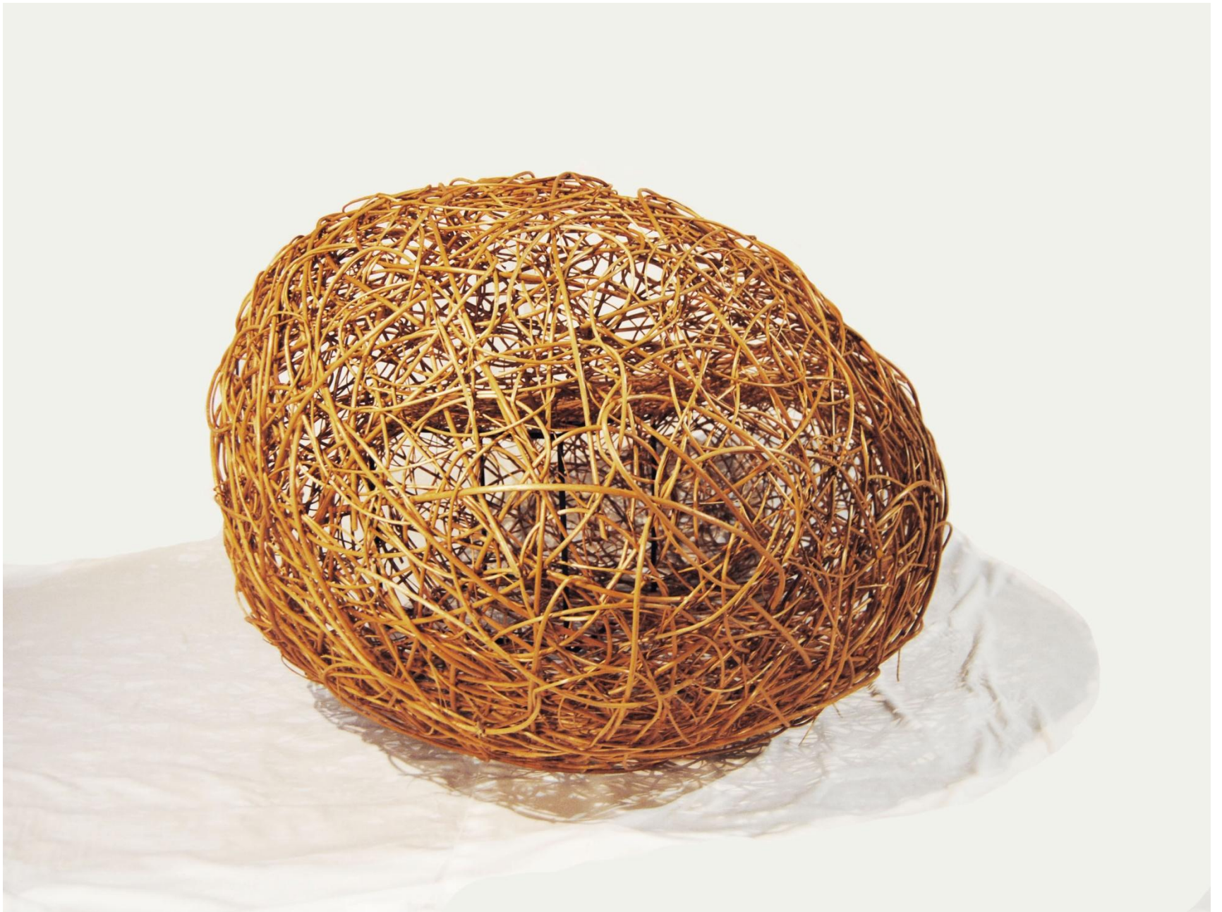
Remiz II rozmiar 106x158x78 cm wiklina