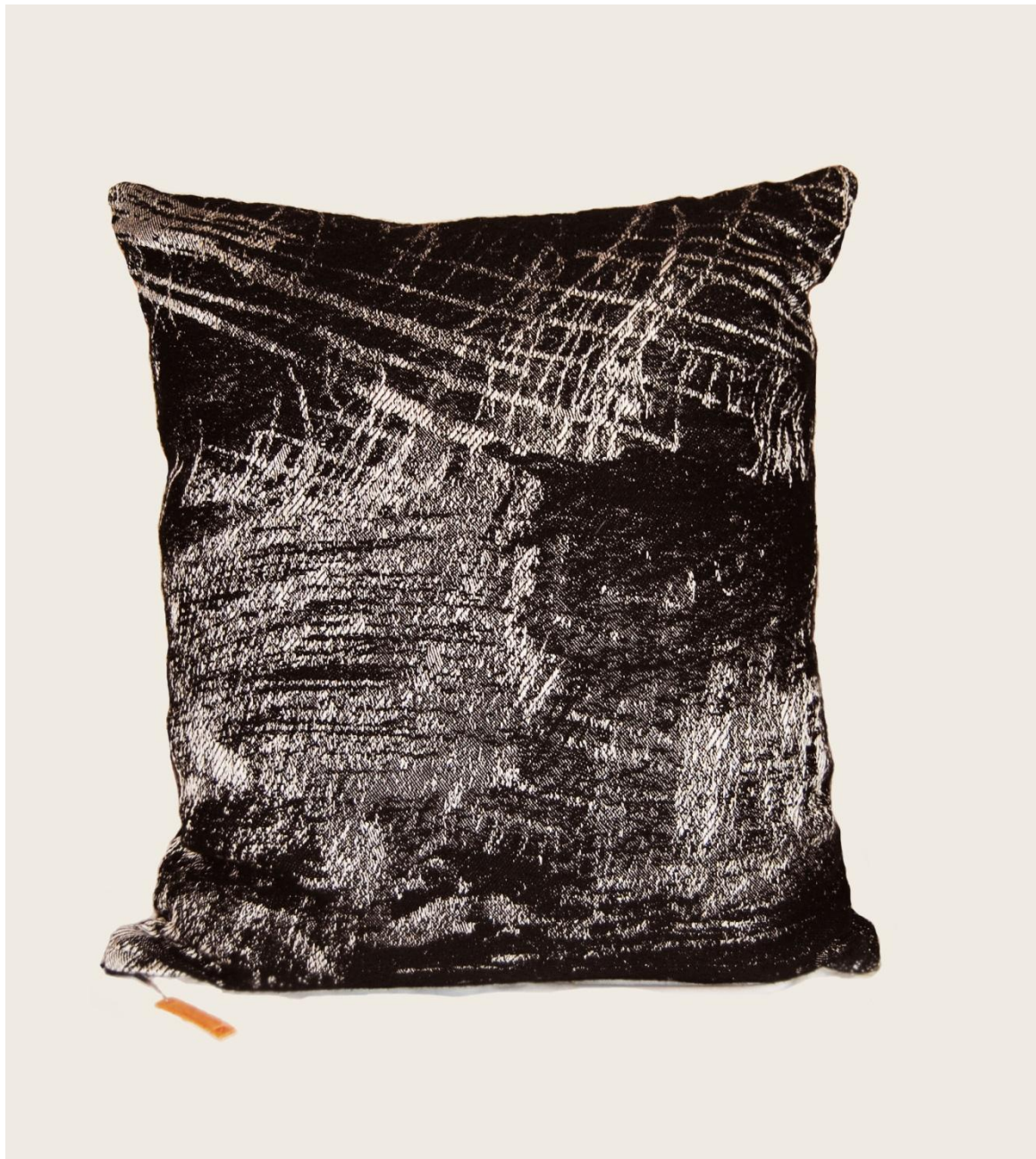
Burza, 65x75x30 cm. Materiały: len, akryl, bawełna