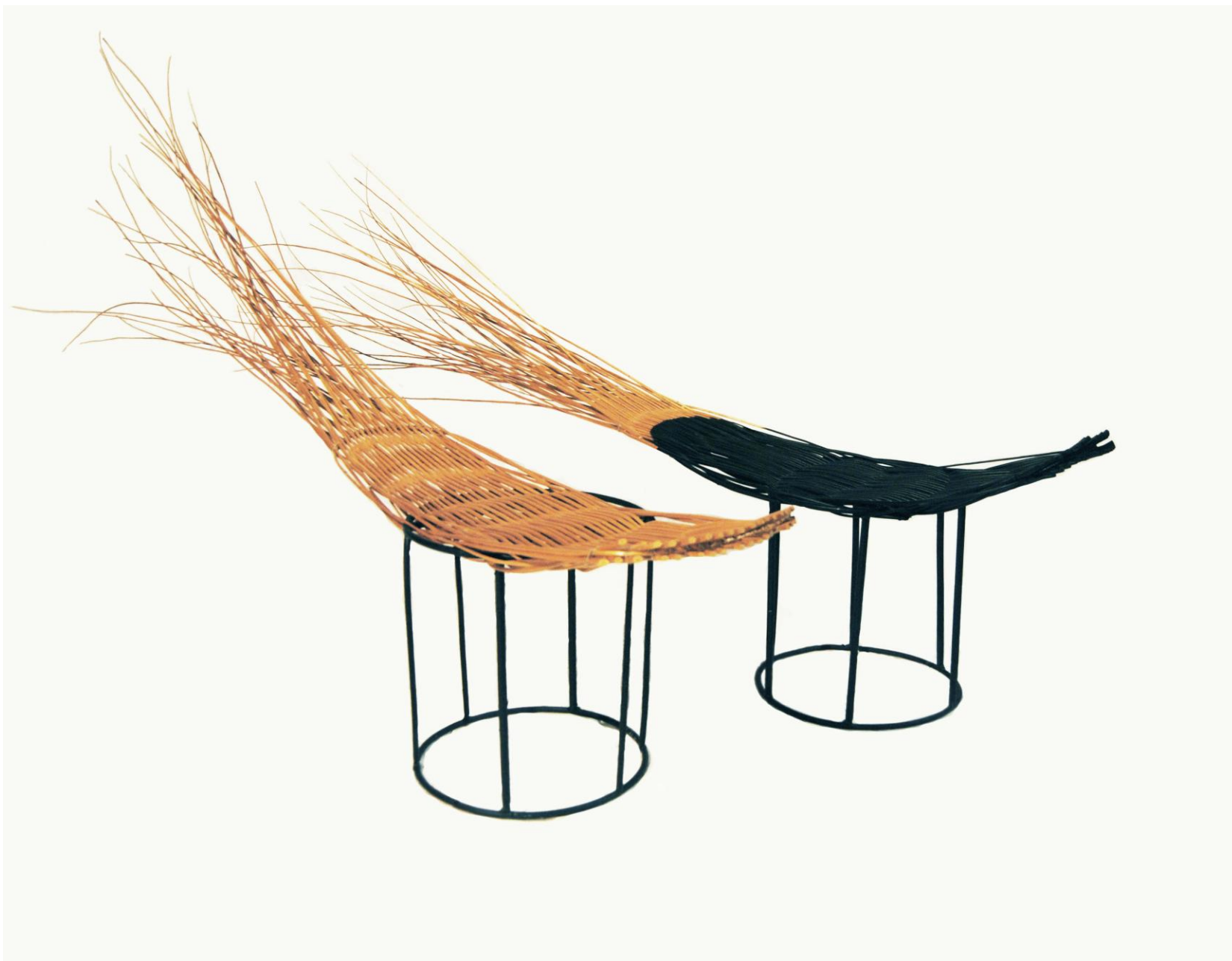
Taborety Jaskółki Wymiary 30x160x110cm Materiały: wiklina, metalowy stelaż