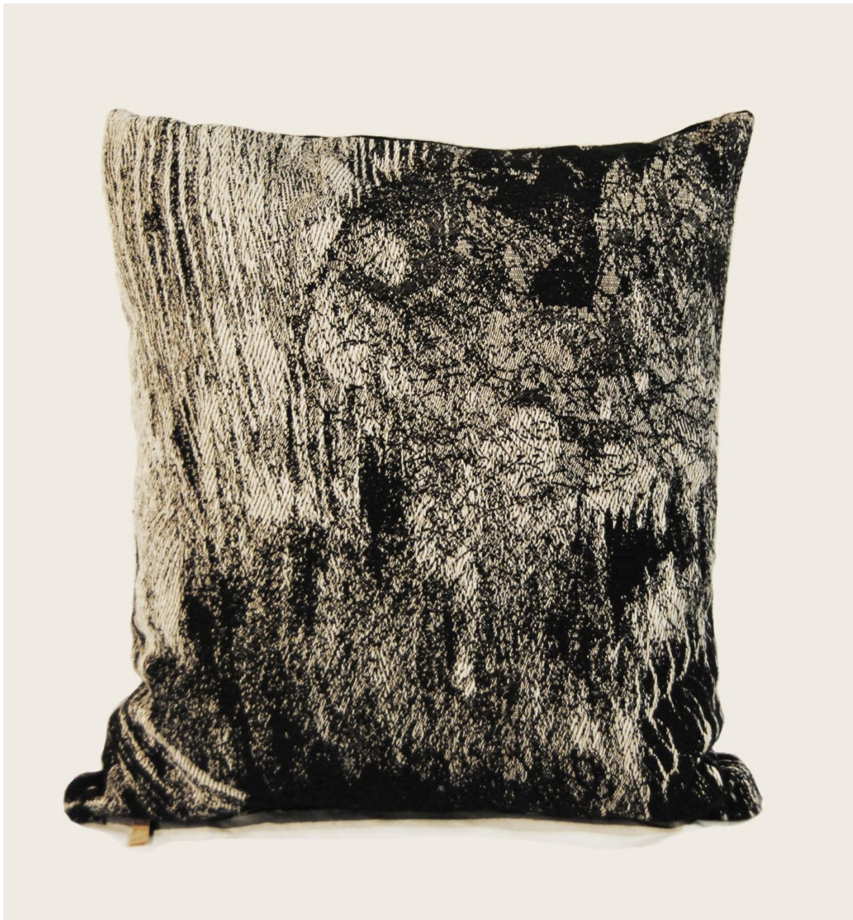
Zamiec, 65x72x30cm. Materiały: len, akryl, bawełna