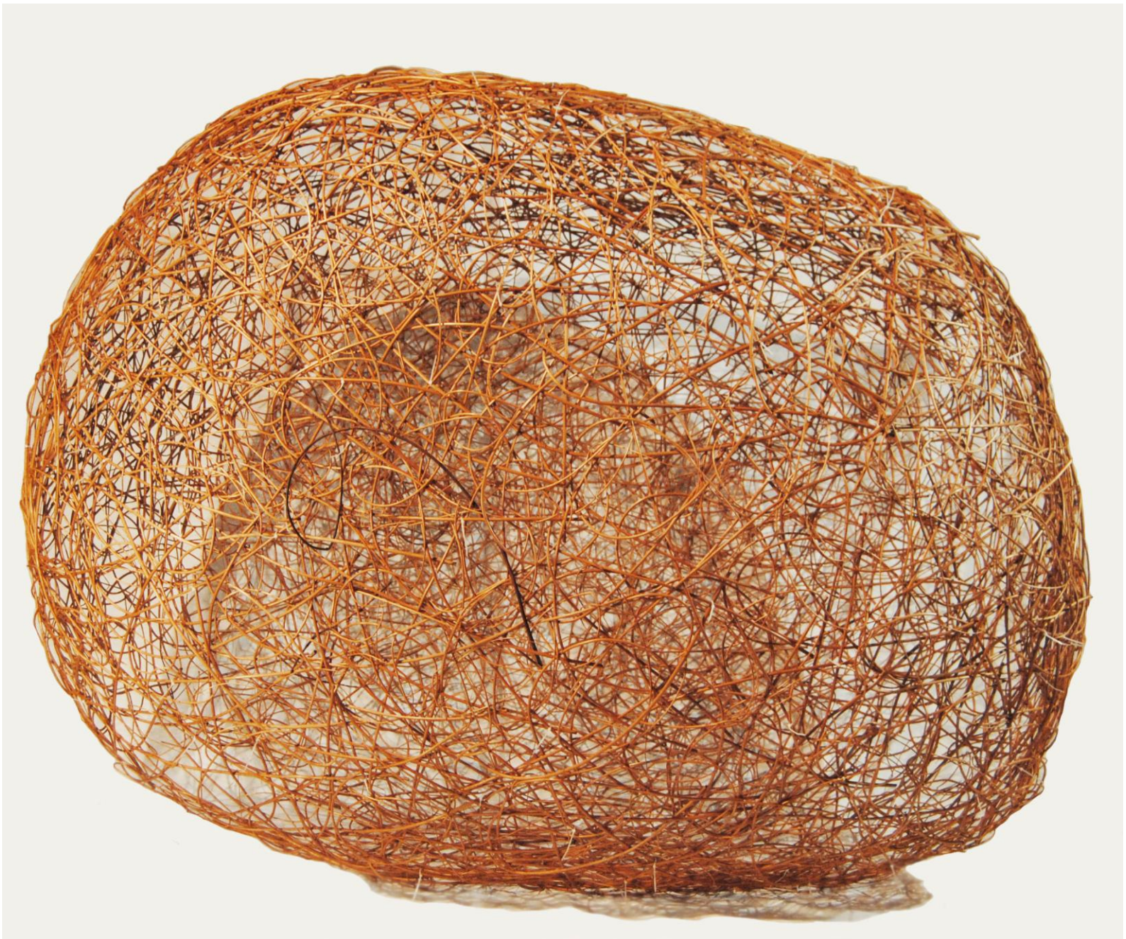
Sroka wiklina 160x230x170 cm