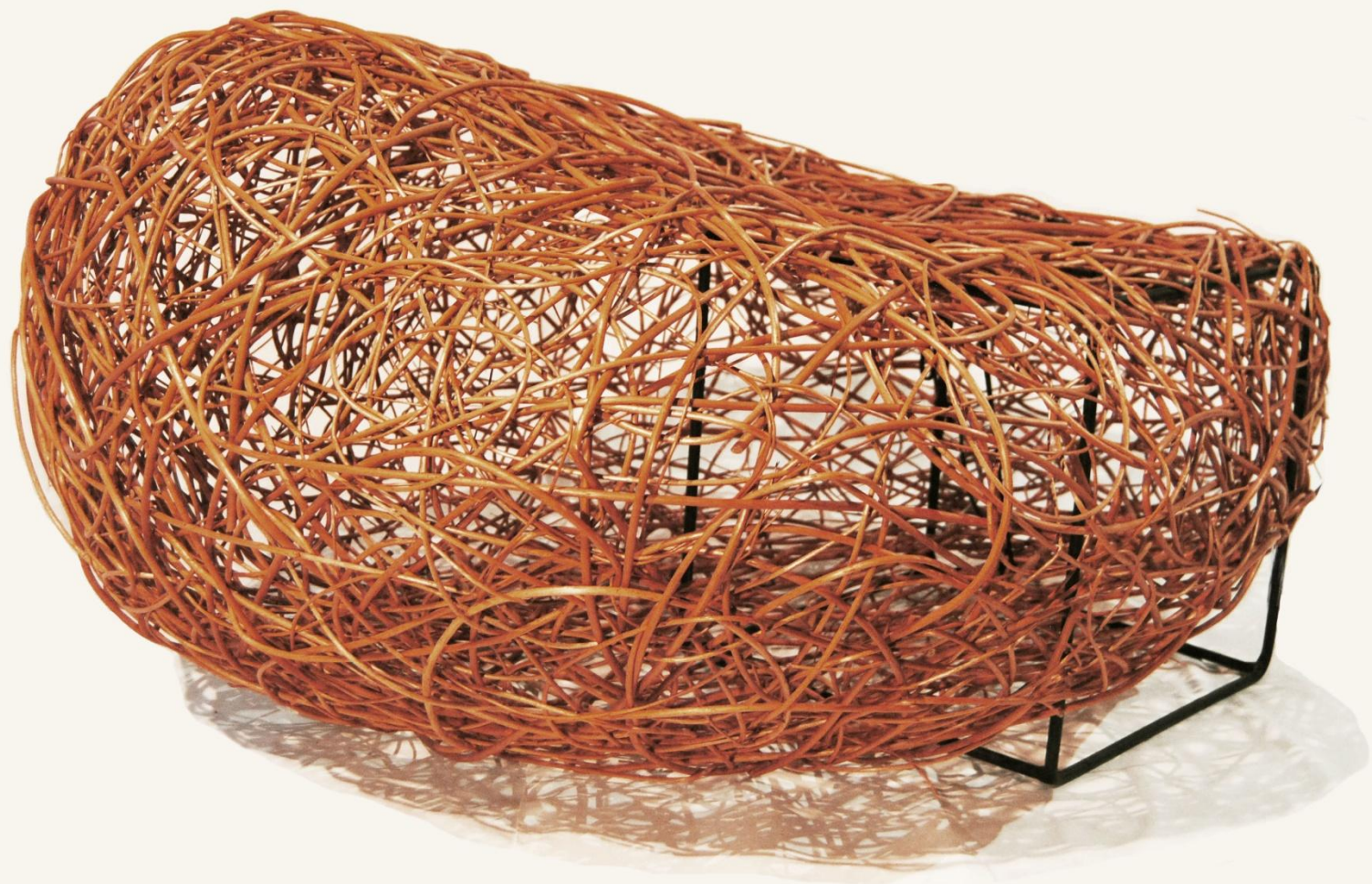
Remiz I rozmiar 110x120x57cm wiklina