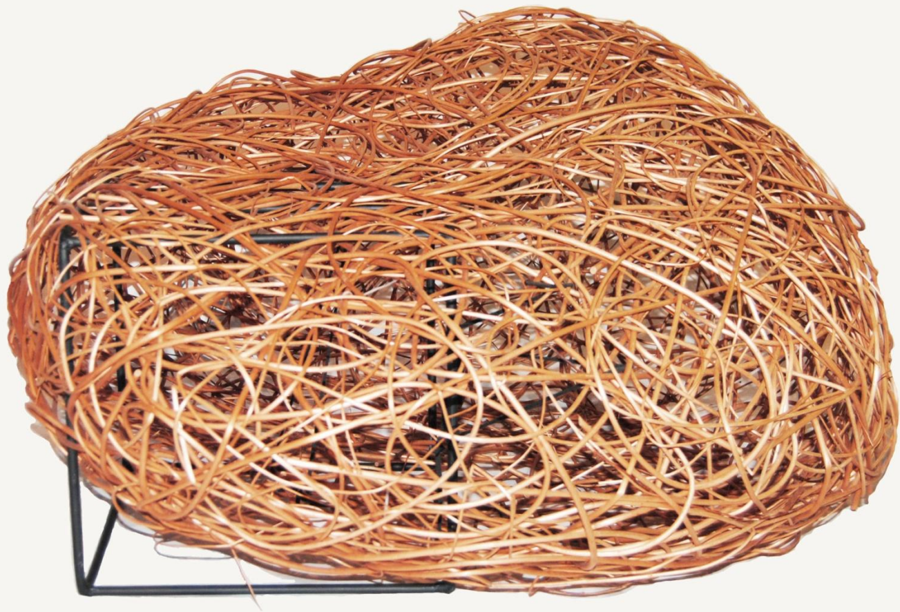
Remiz I rozmiar 110x120x57cm wiklina