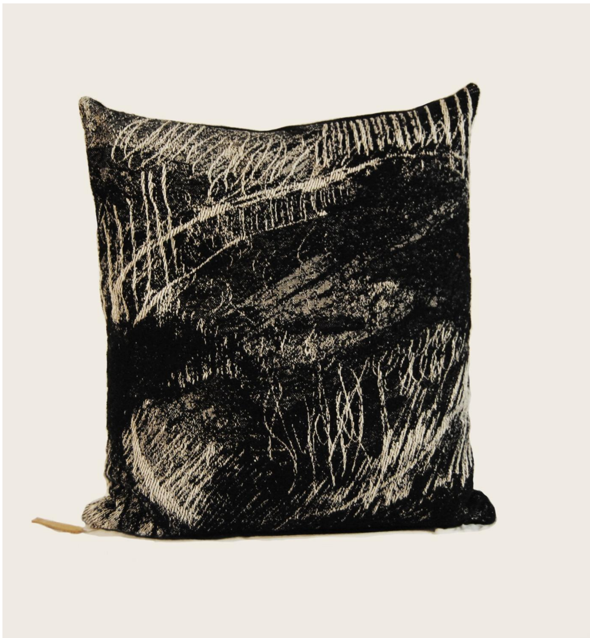
Sitowie, 65x74x30cm. Materiały len, akryl, wełna, bawełna