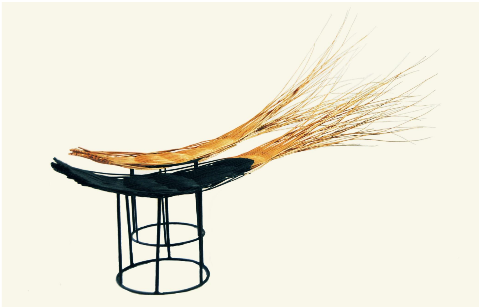
Taborety Jaskółki Wymiary 30x160x110cm Materiały: wiklina, metalowy stelaż