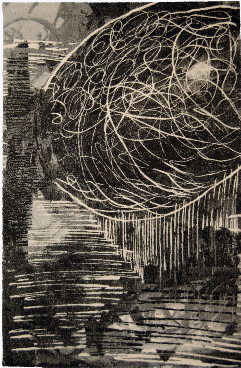
Przestrzeń I, 200x300cm, Aksminster