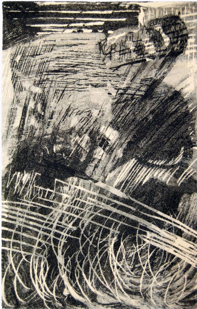
Przeźrzenie III, 200x300cm, Aksminster