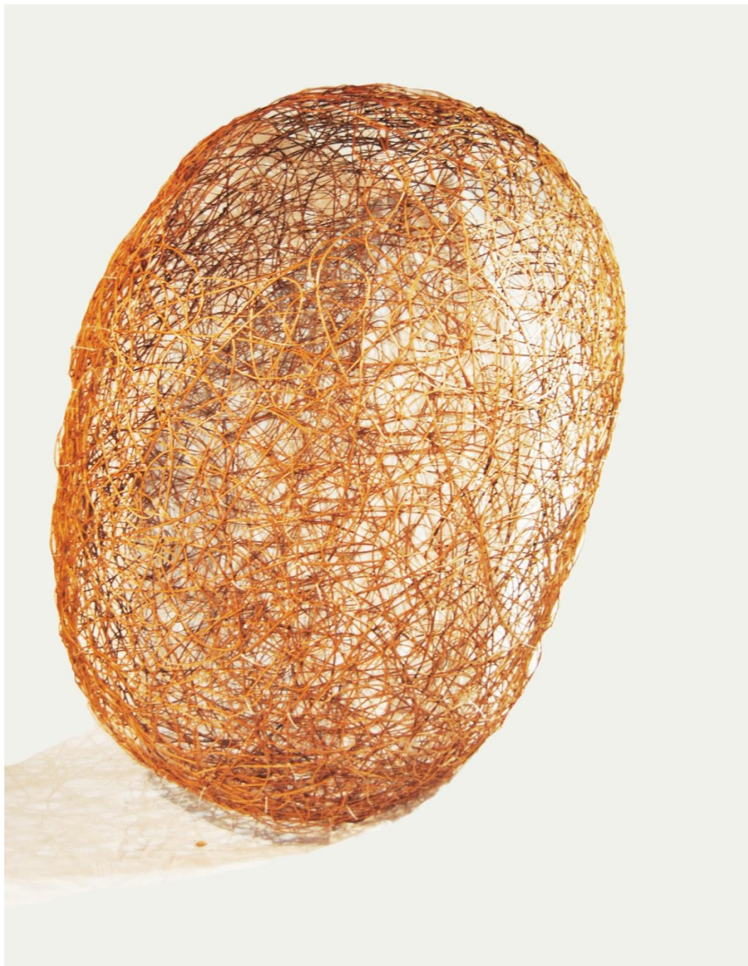
Sroka wiklina 160x230x170 cm