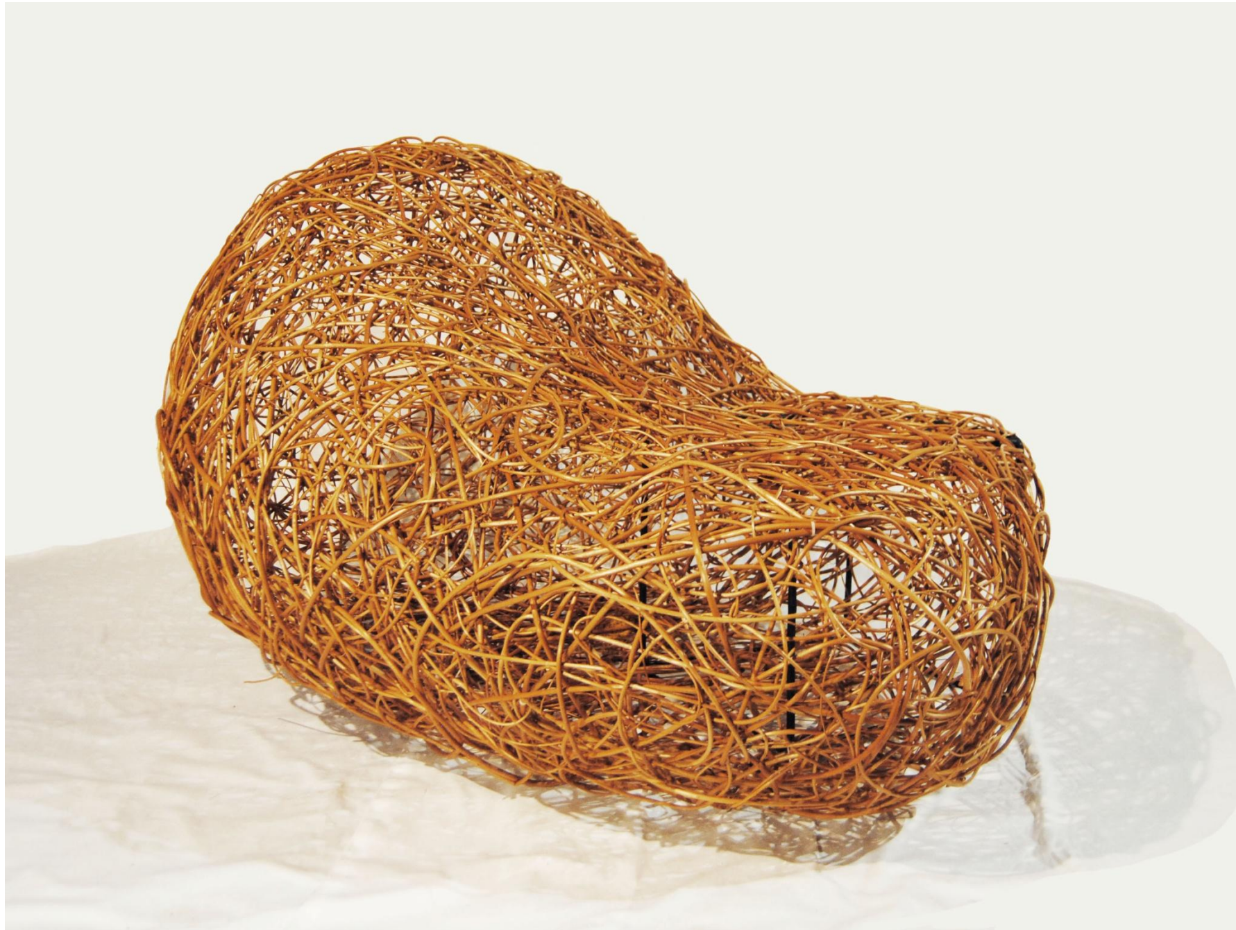
Remiz II rozmiar 106x158x78 cm wiklina