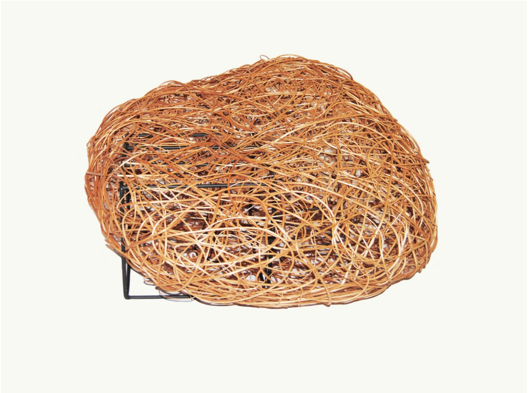
Remiz I rozmiar 110x120x57cm wiklina