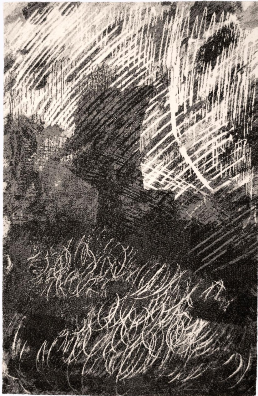
Przeźnięć II, 200x300cm, Aksminster