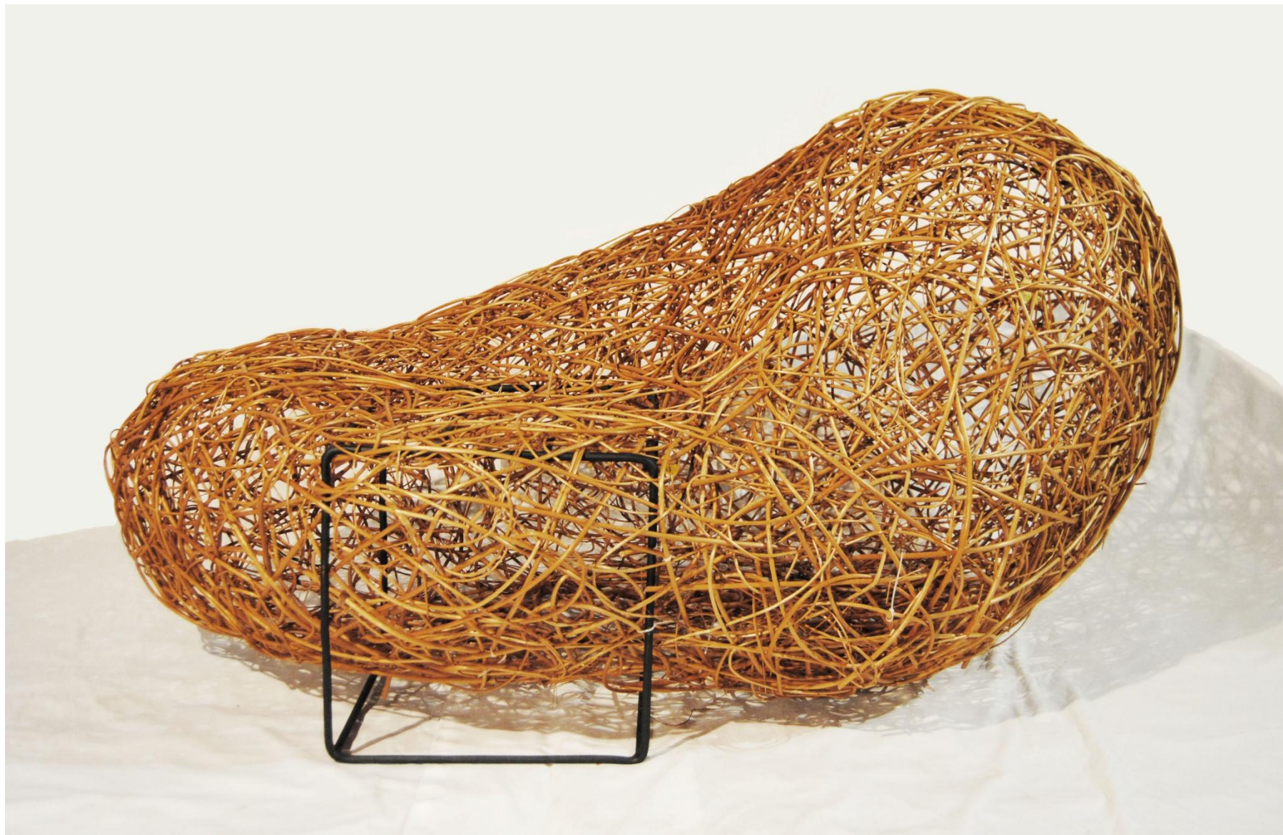
Remiz II rozmiar 106x158x78 cm wiklina