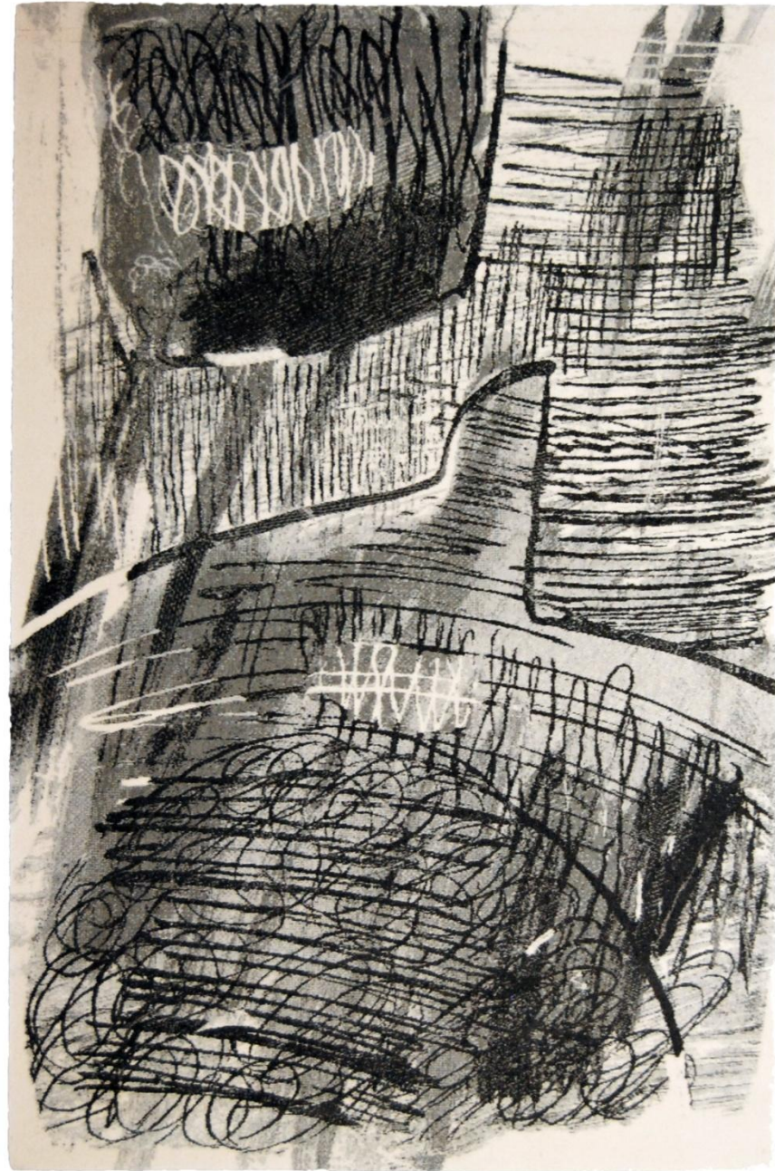
Przeźreń IV, 200x300cm, Aksminster